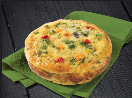
Quiches sans croûte aux légumes du jardin