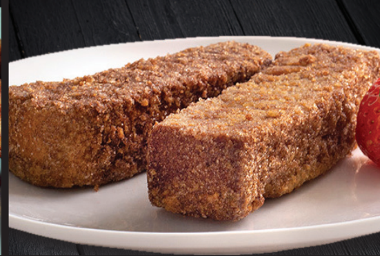
Bâtonnets de pain doré