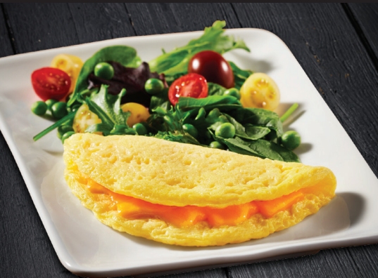
Omelette au fromage colby