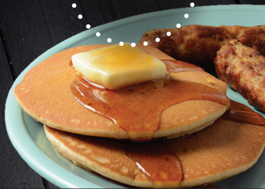
Crêpes au babeurre, à l'érable et à la cannelle